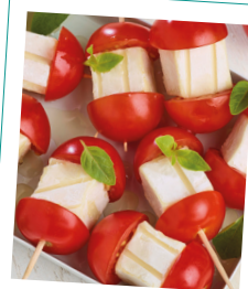
P'tit Pavé Nature et sa tomate

*Source : Données Food Usage - Consommation à domicile + emporté du domicile - Base individus - CAM P6 2016