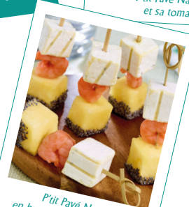
P'tit Pavé Nature en brochette ananas crevette