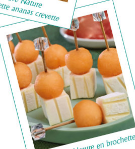
P'tit Pavé Nature en brochette et bille de melon